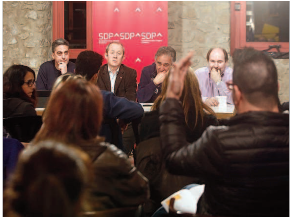
Un moment de la reunió pública, ahir, a Santa Coloma.

D’altra banda, el número u de la territorial, Delfí Roca, va defensar el paper del teixit associatiu i es va mostrar molest amb les “etiquetes” que se li posen al poble de “lloc de pas o zona industrial”. De fet, va indicar que la “singularitat és un plus” per ajudar en la reactivació econòmica, i considera Santa Coloma un lloc idoni per