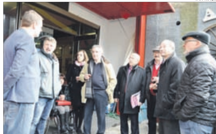
Els candidats d'SDP van dinar ahir a la Casa de Portugal.