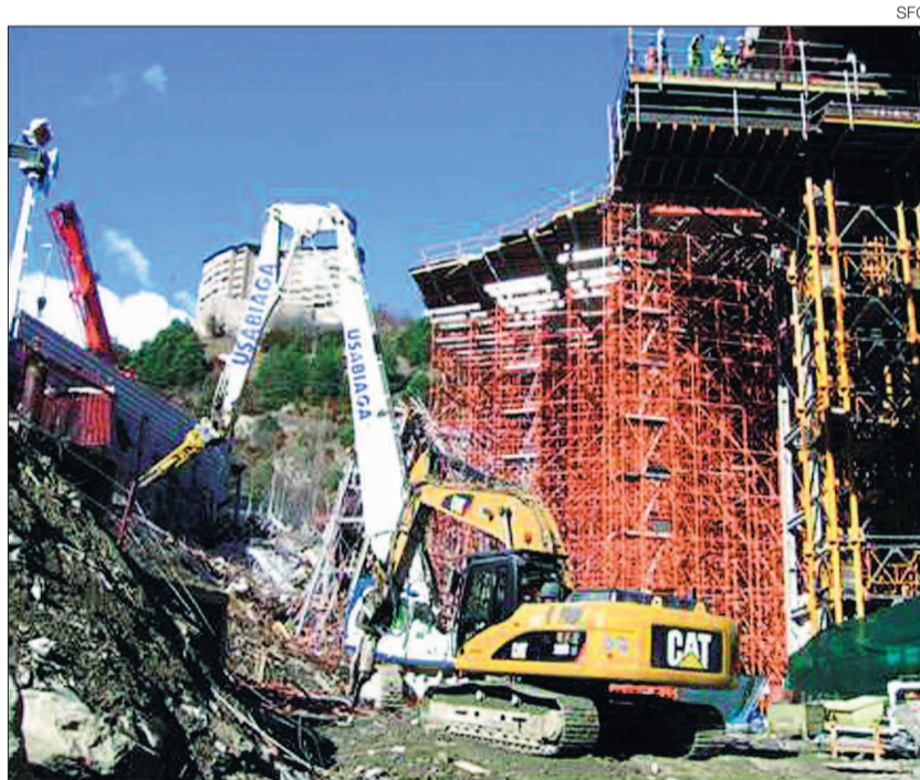
►► Els treballs d'enderroc de l'estructura E2, aquest febrer,

del ministeri de l'Écologie, du Développement Durable, des Transports et du Logement de França. L'anàlisi, entregat aquest desembre, determina que l'incident del maig no va malmetre la resistència ni la durabilitat de l'estructura, i que les operacions fetes fins ara per la constructora són pertinents. El dictamen també fa diverses recomanacions sobre com recuperar l'estructura.