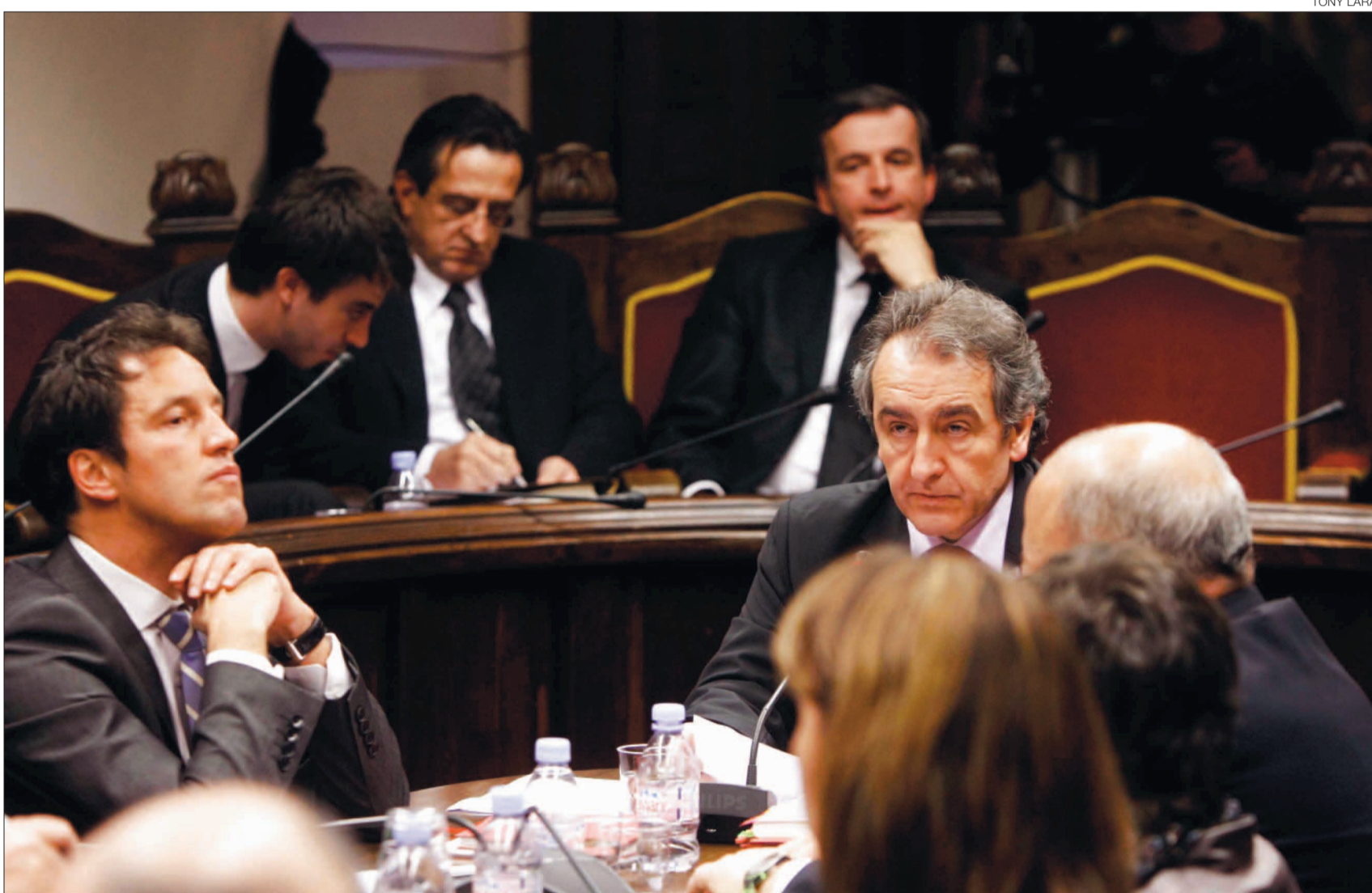
► El cap de Govern, Jaume Bartumeu, en la compareixença davant del Consell General del 23 de desembre, quan va informar sobre l'acord monetari.

RETRETS A L'OPOSICIÓ // El cap de Govern va lamentar la situació política que es viu a Andorra, que atribueix a la constant voluntat de bloqueig per part dels partits de l'oposició. De fet, els va retreure no jugar el joc parlamentari normal amb un govern en majoria relativa, que en el cas del pressupost, i sempre segons la seva