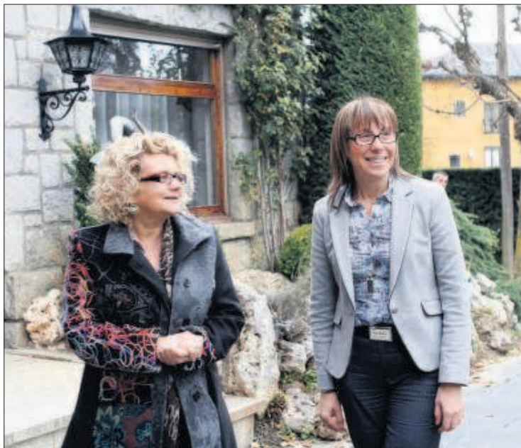
Geli i Bonet es van reunir ahir a la tarda a Puigcerdà.

Andorra i Catalunya constituïran una comissió mixta de treball en l'àmbit de la salut per consolidar i desplegar l'acord de cooperació sanitària signat entre el Govern i la Generalitat el 3 de setembre passat. I una de les primeres qüestions que es tractaran serà la de la col·laboració d'emergències mèdiques als dos territoris. Entre d'altres, es determinarà com i en quins supòsits es treballarà conjuntament per gestionar emergències mèdiques, especialment després que Andorra ja disposi d'un helicòpter medicalitzat biturbina que permet traslladar malalts a hospitals de referència en qüestió de minuts.