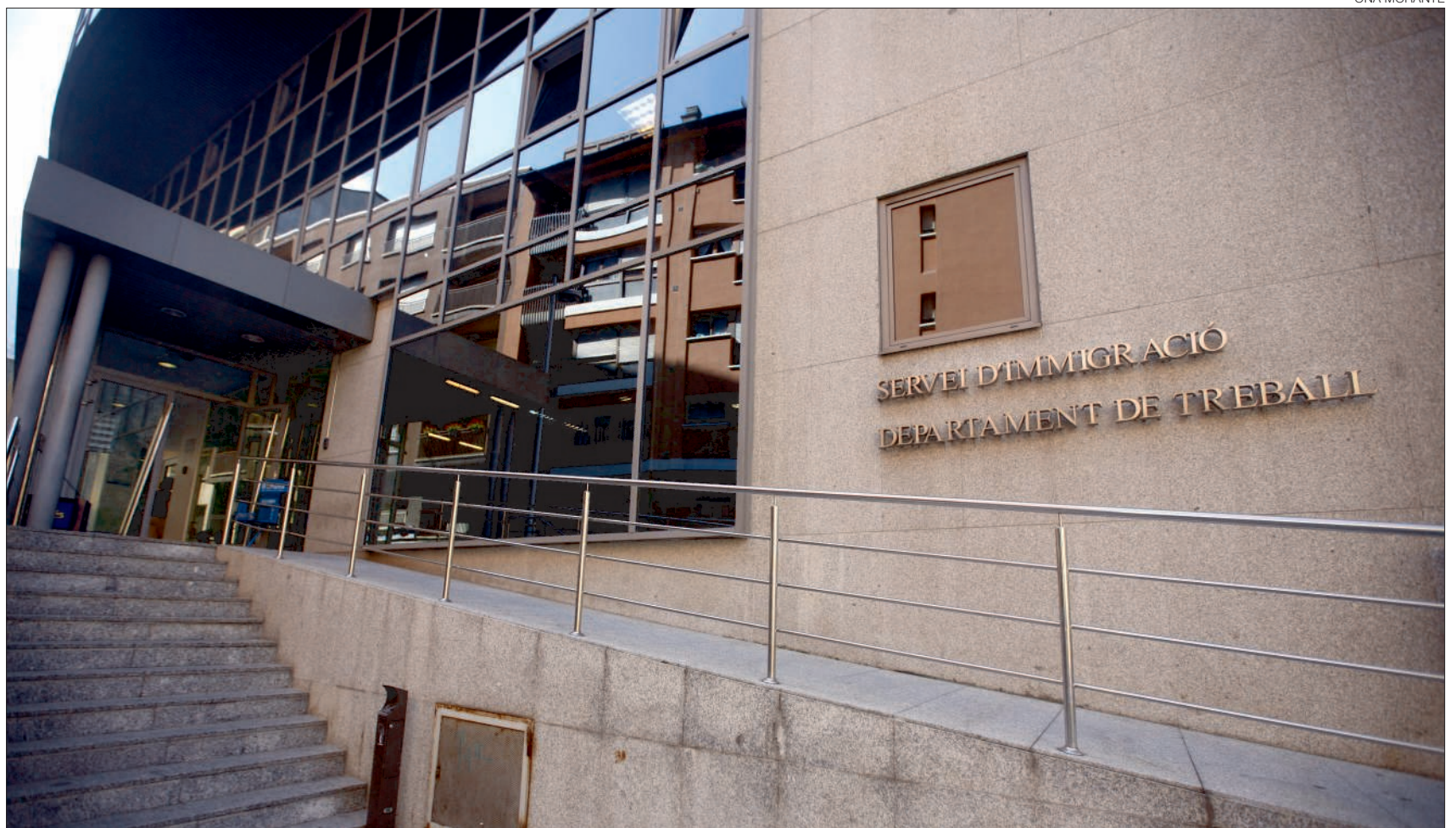
► La façana del Servei d'Ocupació del Departament de Treball, al carrer de les Boïgues d'Escaldes-Engordany.

Des d'Ocupació s'està treballant per estudiar els perfils que necessiten les empreses del país que tenen ofertes de treball i també es vol identificar els col·lectius més vulnerables, com a primers destinataris dels cursos formatius. L'edat de l'aturat o l'aturada i el temps que està en recerca de treball seran altres criteris que es tindran en compte. A més, també s'ha d'elaborar el programa de formació específica en l'empresa.