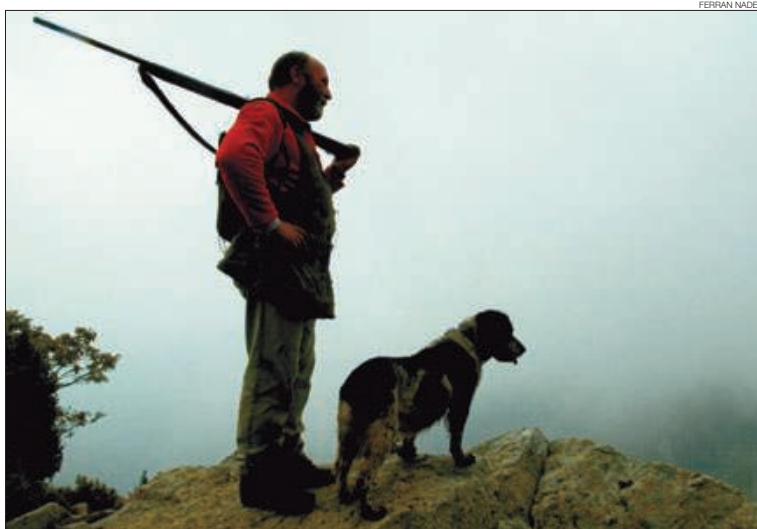
►► Un caçador, acompanyat del seu gos, contempla una zona apte per a la cacera.

Paral·lelament, al ministeri li toca ara començar a treballar perquè la cancel·lació de la temporada de caça de l'isard no s'hagi de repetir l'any vinent. Alay va mostrar-se confiat