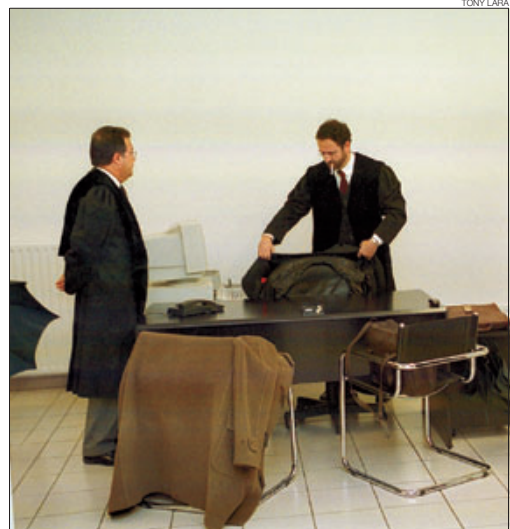
► Dos lletrats, en una sala de la Batllia.

tres grups parlamentaris. El Col·legi d'Advocats reivindica des de fa anys l'assistència lletrada des del primer moment, és a dir, des de la intervenció de la Policia. A la pràctica, la reivindicació s'ha traduït els darrers mesos en un seguit de qüestions prèvies a les vistes judicials, plantejades pels advocats de la defensa i que han portat el Tribunal de Corts a elevar-les al Tribunal Constitucional. Per altra banda, el TC ha de pronunciar-se el vinent mes sobre els recursos d'inconstitucionalitat provocats per les intervencions dels advocats de diversos casos en les respectives vistes davant del Tribunal de Corts, relatives a la manca d'assistència lletrada des del moment de la detenció dels presumptes delinqüents. ▬