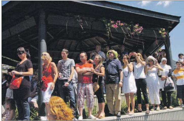
Públic congregat a la giorleta de la plaça del Poble.