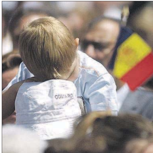
Un nen , a collibè del seu pare, descansa abans dels actes oficials a la plaça del Poble, sota un sol de justícia, que va complicar l'espera.