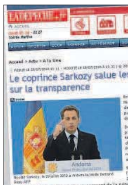
La web d'un dels mitjans.

De fet, la qüestió va acaparar els titulars de la immensa majoria de les informacions que es van publicar hores després de l'estada del cap d'Estat. Els mitjans dels països veïns ressaltaven la lloança del Copríncep envers els progressos fets pel Principat. També que les paraules del president de la República francesa esmentaven els lligams entre els dos països. I com Sarkozy va estendre la mà al microestat veí per enfortir la relació amb Europa.