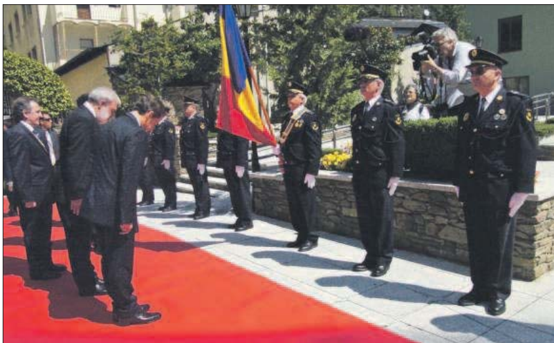
El dirigent francès no va deixar passar per alt ni un detall de simbologia i tot just arribar al recinte de Casa de la Vall va fer la reverència a la bandera nacional.