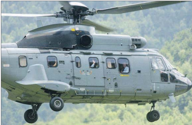
L'helicòpter militar en què viatjava el Copríncep abandona les terres andorranes, abans de les tres de la tarda. Sarkozy s'acomiada del país fent adéu amb la mà.