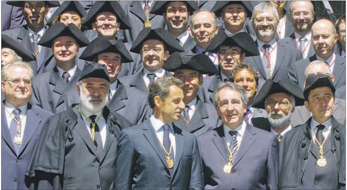
Nicolas Sarkozy entre Josep Dallerès i Jaume Bartumeu en la tradicional fotografia a les escales de Casa de la Vall.

INTENSES DUES HORES I MITJA DEL COPRÍncep FRANCÈS A LA CAPITAL