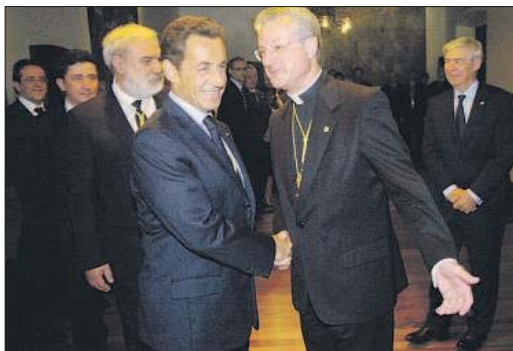
Els Coprínceps se saluden a la sala dels Passos Perduts.

La trobada va durar una dotzena de minuts. No pas més. I va tenir un clima distès. Després de la reunió, l'arquebisbe d'Urgell va mostrar la seva satisfacció