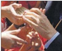
Tothom volia tenir el privilegi de donar la mà al cap d'Estat. Els assistents a la plaça del Poble van fer esforços per mirar d'arribar a saludar Sarkozy.