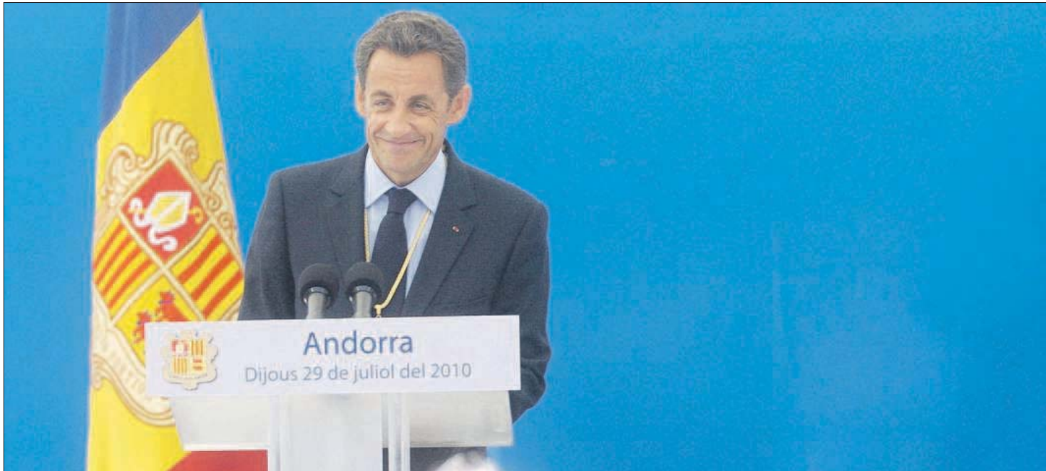
Nicolas Sarkozy somriu durant el seu parlament a la plaça del Poble mentre és ovacionat pel cap de Govern, Jaume Bartumeu, i els ciutadans que s'havien concentrat a l'Indret.