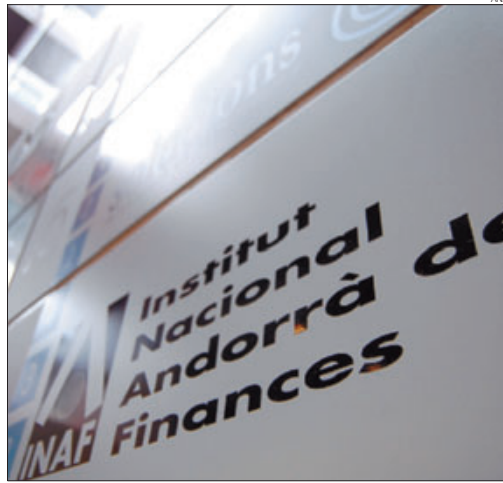
► Les instal·lacions de l'INAF.

Pel que fa a les possibles accions que puguin resultar d'aquestes pràctiques, Bartumeu va informar que des de Govern «no tenim coneixement que s'hagi obert cap expedient ni tampoc no ho hem preguntat de moment» als responsables de l'INAF, que dins les seves competències ja van manifestar que «qualsevol constatació d'incompliment de les instruccions» donaria lloc a «l'obertura de l'expedient administratiu corresponent». Tot i això, el cap de Govern no va descartar demanar informació