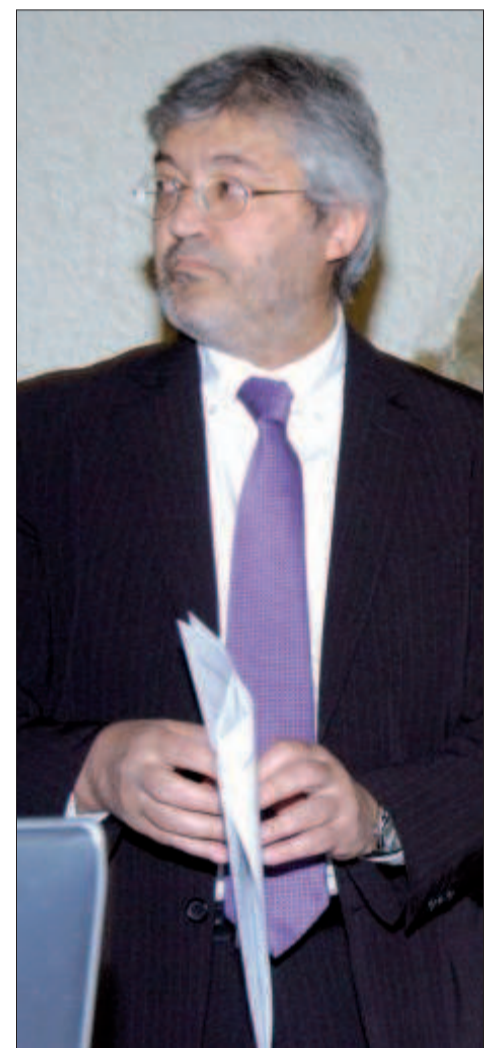
Alay, poc abans de la compareixença.