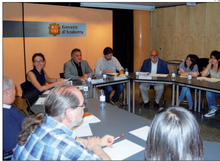
La trobada celebrada ahir a l'edifici administratiu.

La coordinadora governamental va destacar el compromís contret entre els assistents de recuperar el Comitè del Voluntariat d'Andorra i començar a donar-hi forma per posar-lo en marxa al més aviat possible. Es tracta d'un projecte civil que va íntimament lligat a la llei del voluntariat, a hores d'ara a tràmit parlamentari i que permetrà establir una reglamentació d'aquestes pràctiques. Segons Salazar, és bàsic fer un front comú per treballar, i documents com el treballat ahir en reunió permetran cohesionar un col·lectiu ara per ara molt ramificat.