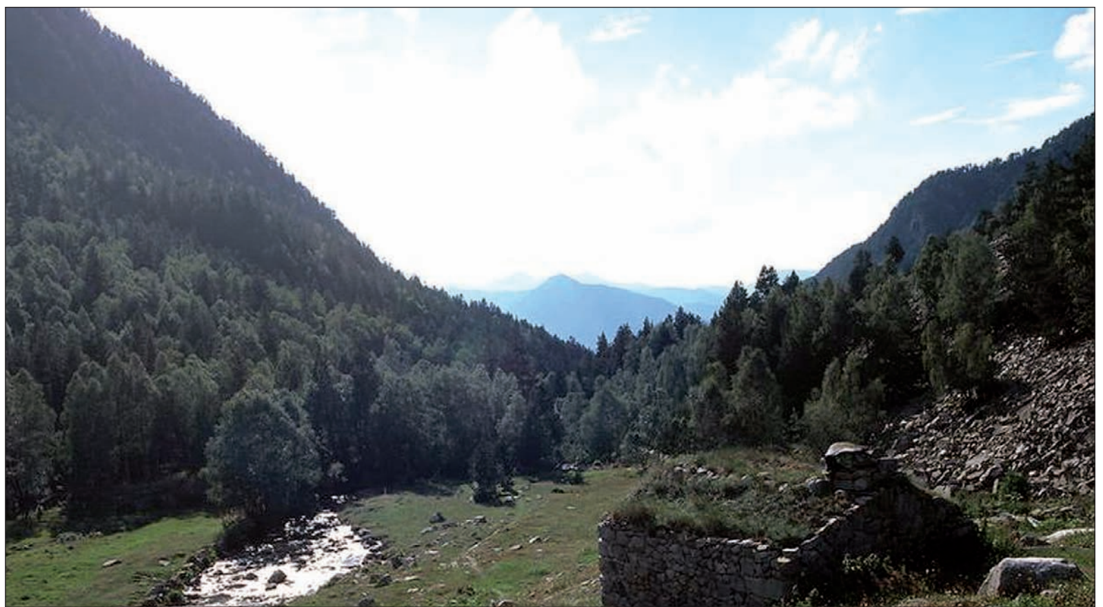
La Unesco va declarar fa uns anys la Vall del Madriu com a bé d'interès cultural.

Segons va donar a conèixer Bartumeu el passat 27 d'octubre hi va haver una reunió entre el Govern i els quatre comuns on està ubicada la Vall del Madriu. Els cònsols van facilitar a l'Executiu un pla de gestió que havien consensuat. Al gener el Govern va remetre als cònsols unes anotacions sobre el projecte que havien presentat i van proposar que una empresa fes la refosa del text. Bartumeu va afegir que a l'abril «adonant-nos que no podíem desencallar» es va decidir que els tècnics del Ministeri de Cultura tre-