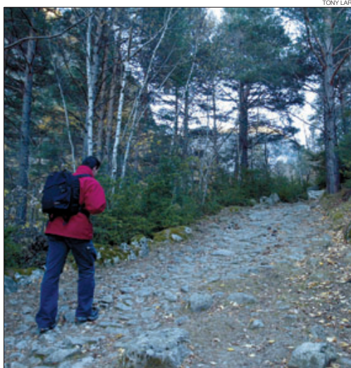
► Un excursionista, a la Vall del Madriu.