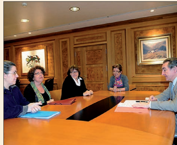
✚ Jaume Bartumeu amb les representants de les associacions.

tats d'aplicació de la nova llei de la Seguretat Social pel que fa a les pensions de discapacitat. Les associacions van demanar al cap de Govern espais que per a les seves dues entitats dins el local ocupat fins ara pel conjunt d'associacions, adherides a la Federació Andorrana d'associacions amb discapacitats. Bartumeu va avançar que el Govern treballa per canviar el reglament de prestacions socials per tenir més en compte els col·lectius més vulnerables.