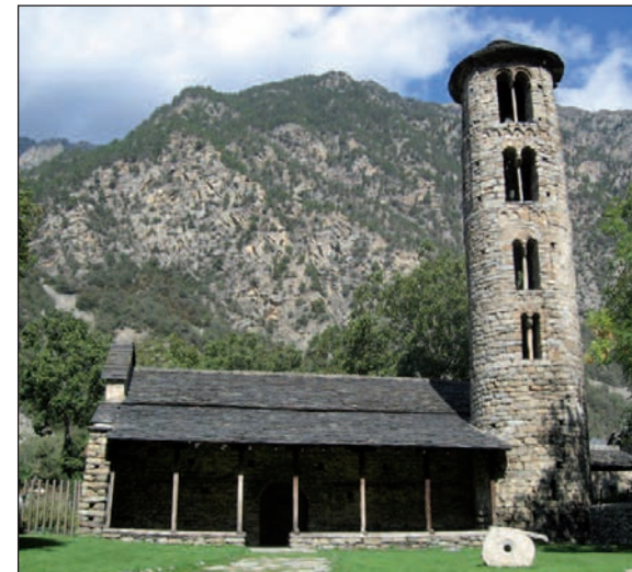
➔ Una de les vistes de l'església de Santa Coloma

La segona zona és la zona formada per dues àrees