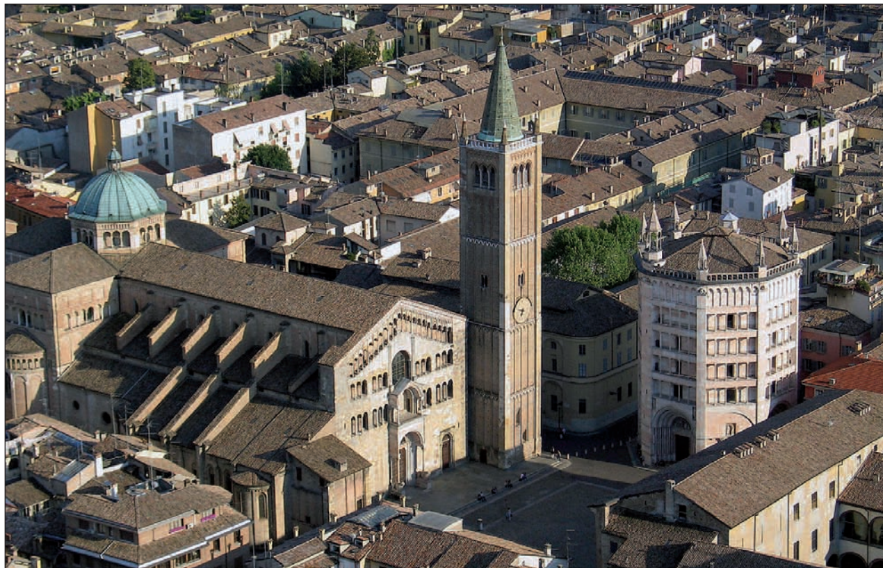
➔ Diversos Estats es van reunir a la ciutat italiana de Parma i van acordar una declaració conjunta.

L'Observatori de Salut i Entorn té l'objectiu de vigilar l'impacte de les condicions mediambientals en la salut de la població, sobretot les que van lligades al canvi climàtic, i obtenir els indicadors adients que permetin prevenir i actuar davant situacions de risc. Pel que fa