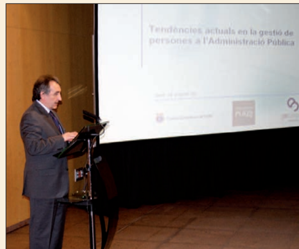
Unes seixanta persones van assistir a aquesta jornada.

Bartumeu va assegurar en el seu discurs que està convençut que l'Administració «ha de tenir un paper bàsic en la societat d'aquest país» i va afegir que no comparteix la política d'externalització i privatització dels serveis públics, duta a terme en èpoques ante-