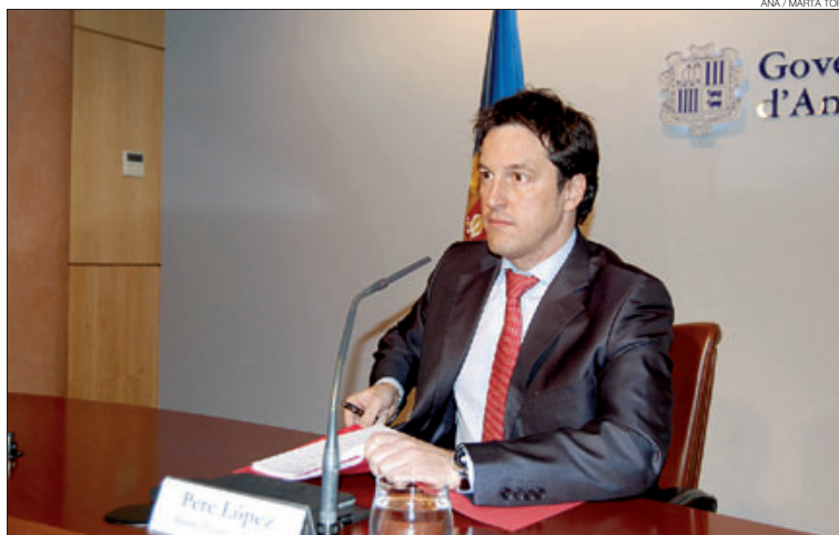
► El ministre d'Economia i Finances, durant la roda de premsa del Consell de Ministres, ahir.

El projecte de llei en qüestió permetrà que el 100% del capital de les entitats bancàries sigui de titularitat estrangera, una possibilitat que en l'actualitat està restringida al 49%, reservant sempre una majoria de l'accionariat en mans andorranes. D'altra banda, segons ha pogut saber aquest rotatiu, el text també incorporarà una sèrie de llicències amb una durada determinada per a l'establiment d'entitats bancàries estrangeres. L'última llicència per a l'establiment d'entitats bancàries estrangeres, concedida per un dels ga-