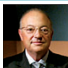
XAVIER ESPOT Afers Exteriors i Relacions Institucionals