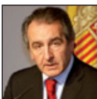
JAUME BARTUMEU Continua assumint les competències de Justícia