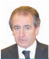
JAUME BARTUMEU CASSANY, CAP DE GOVERN