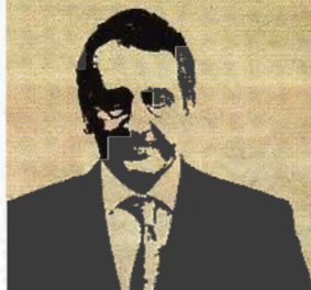
Jaume Bartumeu Cassany