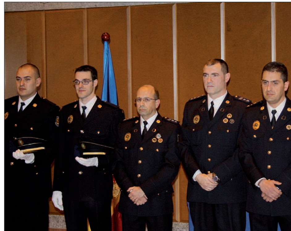
➔ Alguns dels nous agents que van jurar el càrrec amb els seus comandaments.