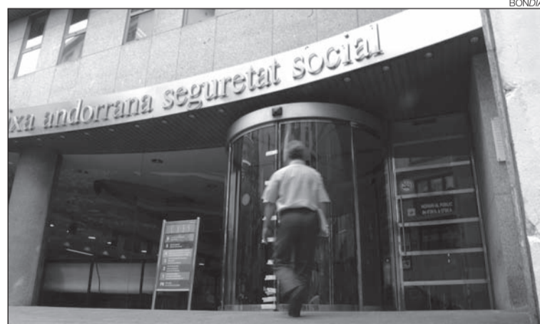
La CASS encara no havia facilitat les dades demanades pel Govern.

que l'objectiu no és altre que comptabilitzar "el nombre exacte de persones aturades" per poder-les ajudar provisionalment amb la seva situació laboral.