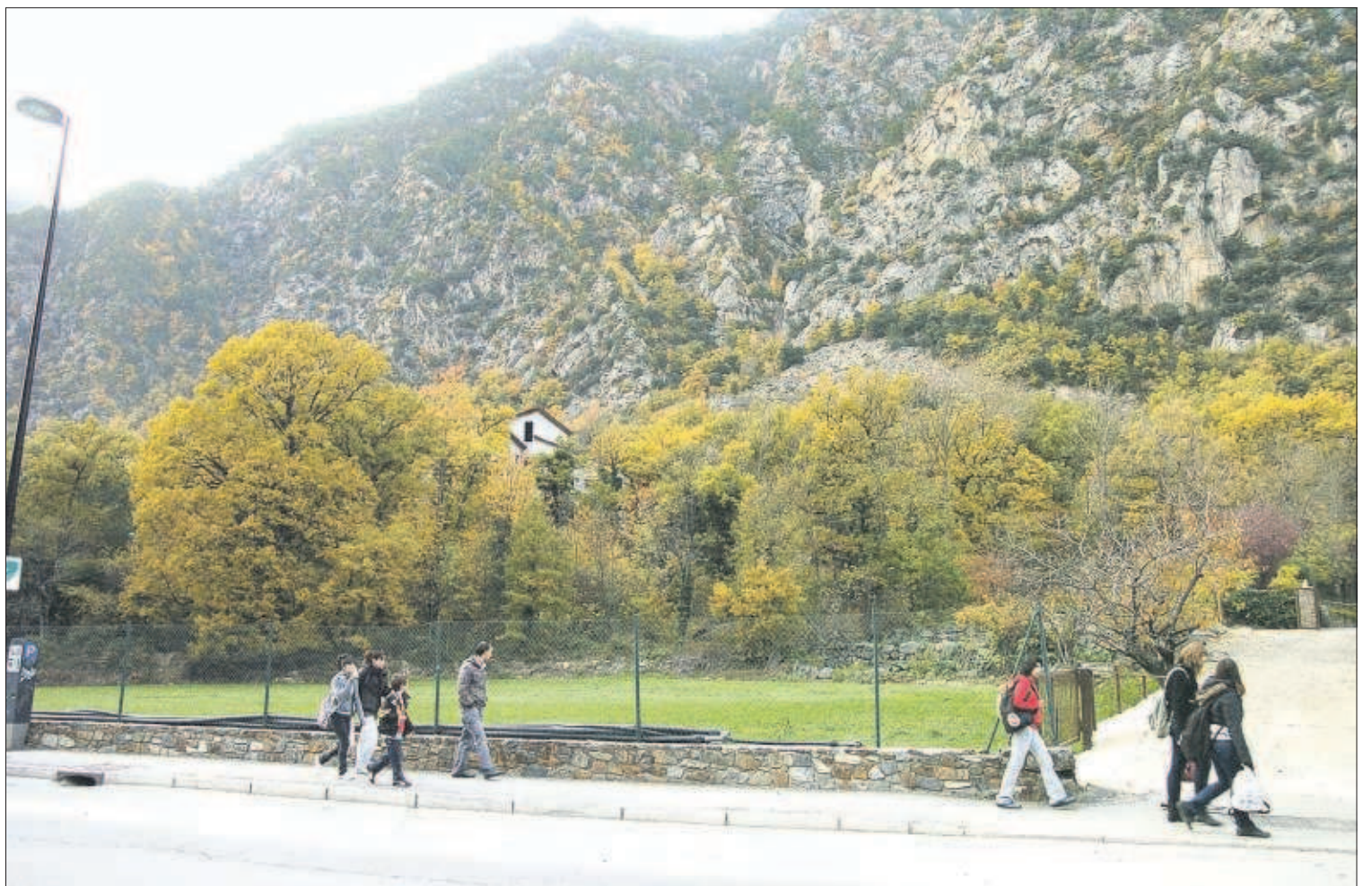
Els terrenys propietat del Govern a la capital que opten a acollir el nou edifici de l'Arxiu Nacional ara per ara són una roureda.

Com a exemple de conceptes ja abonats, la ministra es va referir a despeses de viatges: "Es pagaven a través d'una agència, i ells han tornat a carregar aquells bitllets d'avió o càrrecs d'hotel." Es temen que aquesta situació hagi tingut lloc anteriorment, va confirmar Vela, i per això estan revisant tots els pagaments fets.