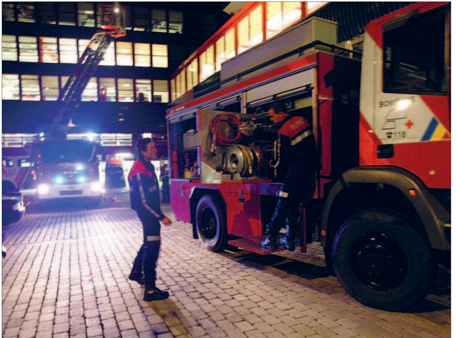
La caserna de bombers de Santa Coloma, on es preveu ubicar les dependències centrals del centre nacional d'emergències.

Tot i l'aturada del projecte, el Govern manté la intenció de disposar al més aviat possible d'una infraestructura que es considera "molt necessària". Per això, els