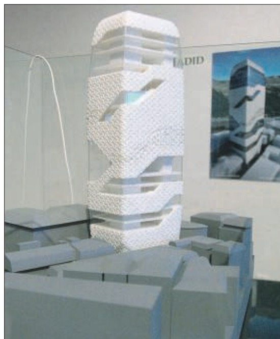
La proposta vertical de Zaha Hadid. D. S.