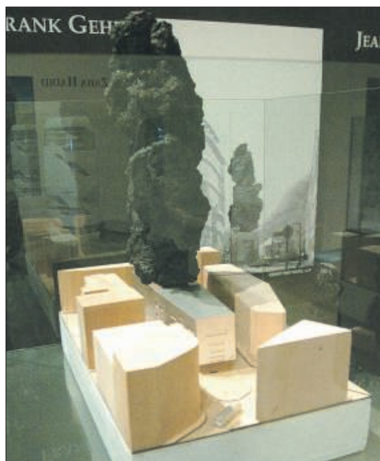
Frank Gehry, projecte retirat.