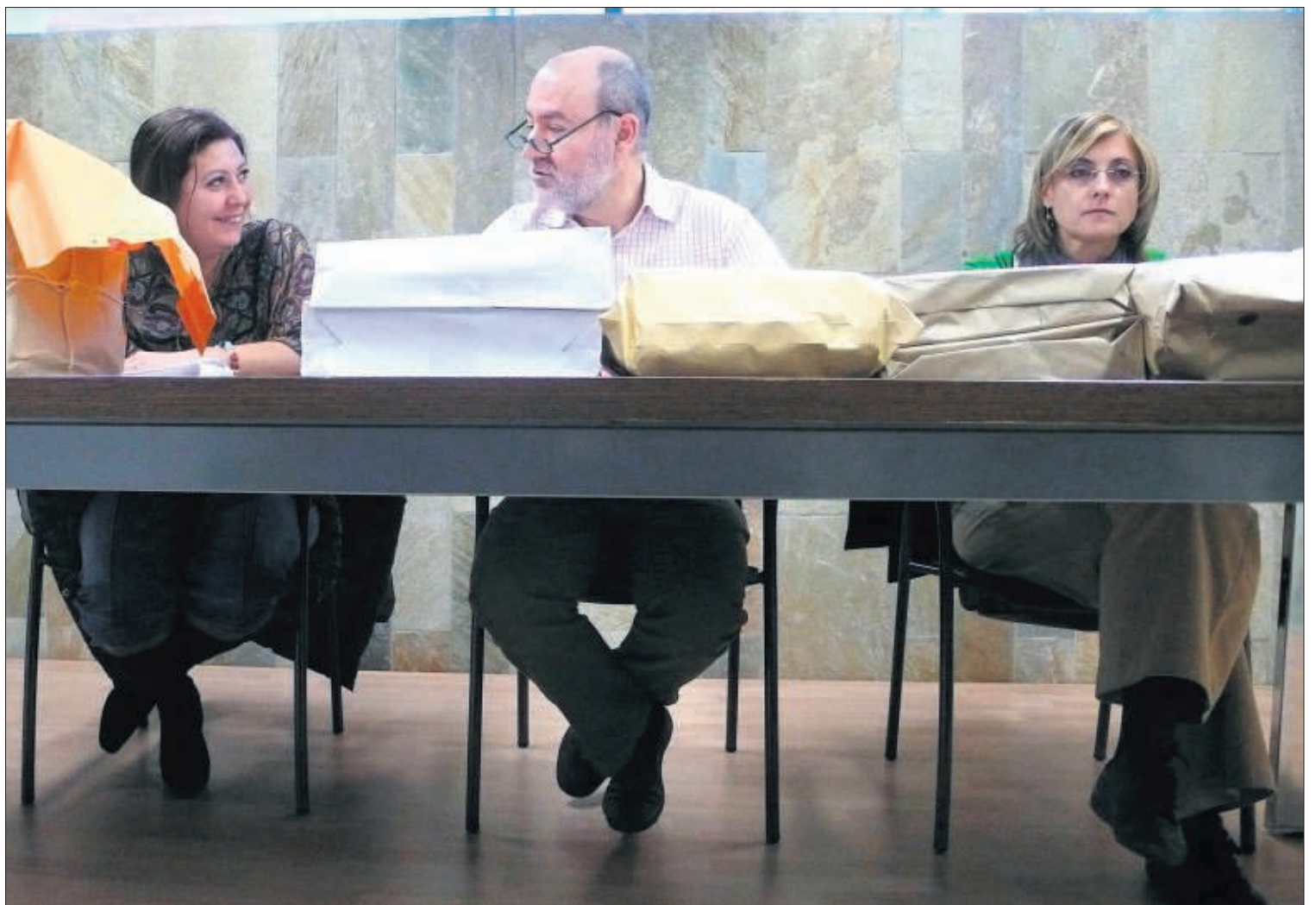
Tres funcionaris treballant a les dependències que el Govern té a l'edifici del Prat del Rull.