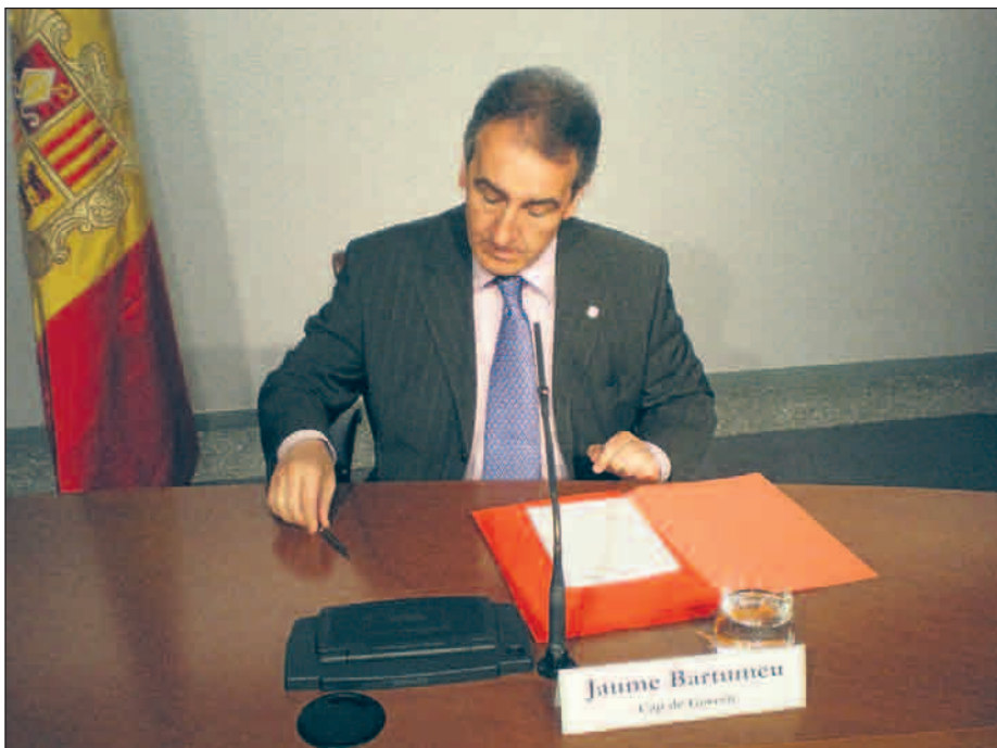
El cap de Govern, Jaume Bartumeu, va comparèixer davant els mitjans de comunicació.

El líder de l'Executiu, Jaume Bartumeu, va recordar que el G-20 es torna a reunir el 24 de setembre, aquesta vegada als Estats Units, i va afegir que «entenc que llavors haurem d'haver fet els passos necessaris perquè no es fixin en nosaltres». Es referia als compromisos que Andorra va contreure per poder deixar de ser catalogat com a paradís fiscal. Bartumeu va fer aquestes declaracions després