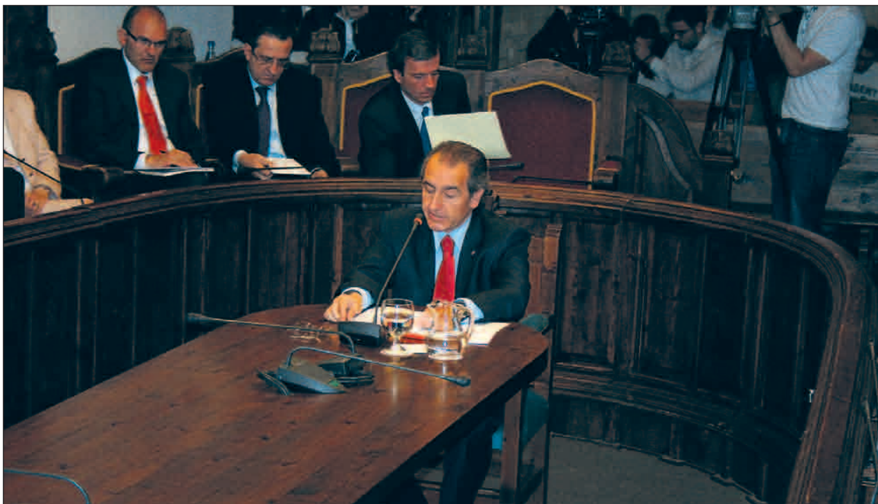
↓ Jaume Bartumeu, pronunciant el seu discurs d'investidura al Consell General.

La política econòmica és la primera qüestió en què Bartumeu vol treballar con-