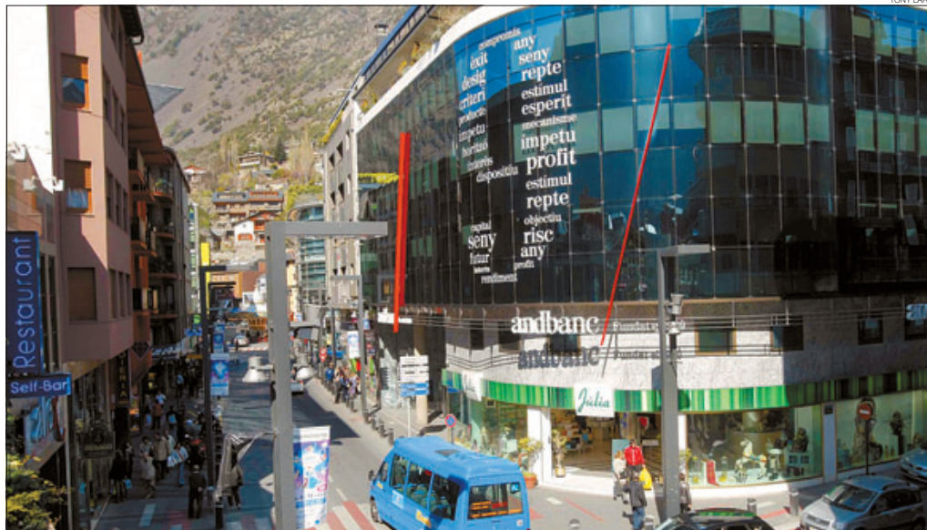
► Una oficina d'Andbanc al centre d'Andorra la Vella.

PIB PER CAPITA 36.734 euros Per sobre dels 24.200 euros d'Espanya, però per sota de Suïssa o Luxemburg PIB TOTAL 2.700 milions