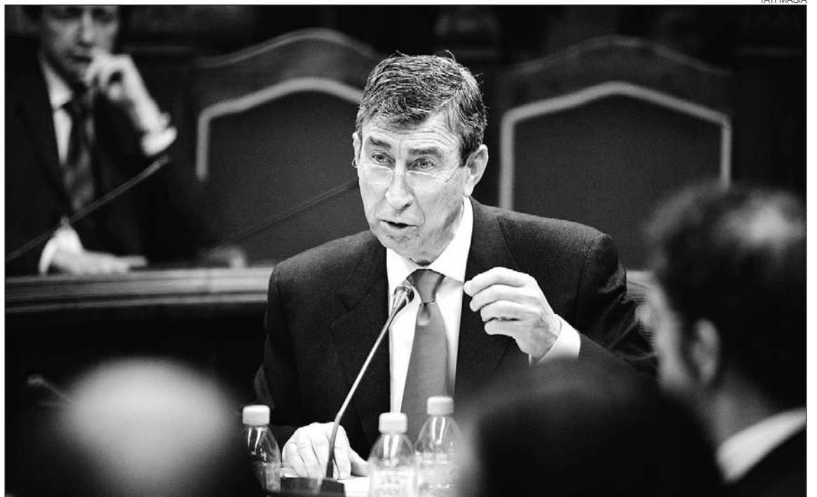
El cap de Govern, Albert Pintat, en un moment de la seva intervenció ahir al Consell General.

No obstant, va seguir el cap de Govern, aquesta situació i el convenciment que el camí recorregut per Andorra era el correcte canvia per tres fets fonamentals, com són la crisi entre Alemanya i Liechtenstein,