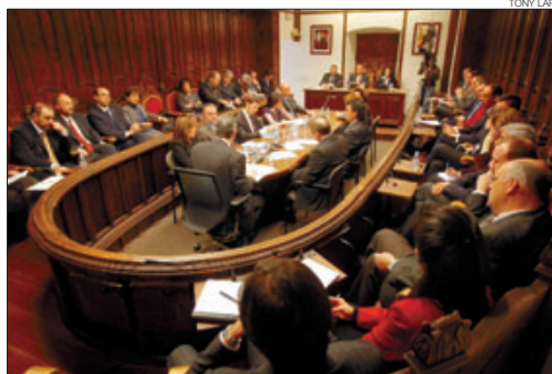
►► Atents ► Els assistents a la sessió extraordinària, ahir.