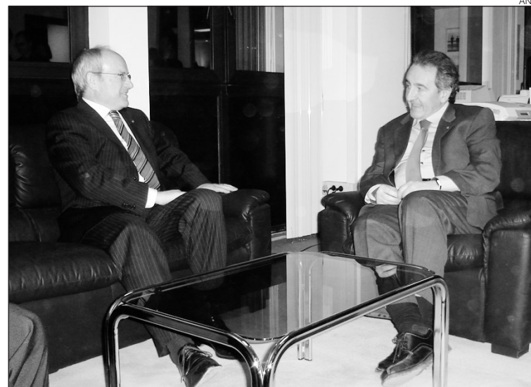
José Montilla i Jaume Bartumeu, durant la reunió d'ahir a l'ambaixada espanyola.

Finalment, el màxim responsable del Govern català es va reunir amb el candidat a cap de Govern, Jaume Bartumeu, a les instal·lacions de l'ambaixada espanyola. Bartumeu i Montilla, els partits dels quals estan agermanats sota la mateixa Internacional Socialista, van intercanviar punts de vista sobre aspectes de l'actualitat política del moment.