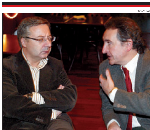
►► Blanco i Bartumeu, en un acte a Andorra el 2005.