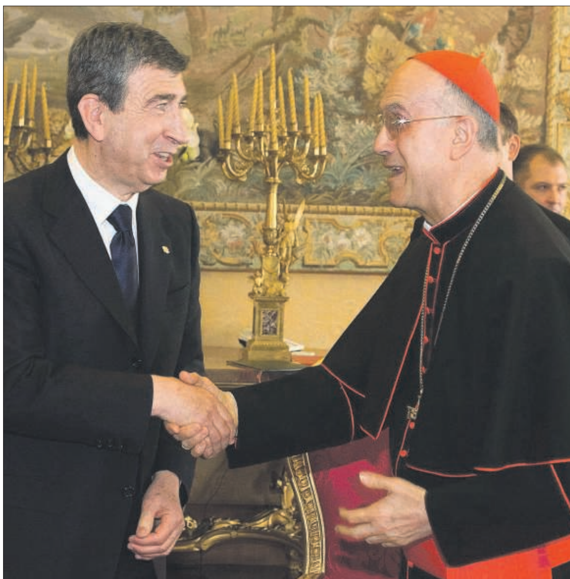
El cap de Govern, Albert Pintat, amb Tarcisio Bertone, secretari d'Estat del Vaticà.

El PS també posa en dubte que a aquells centres d'ensenyament de l'església, l'assignatura de religió tingui "condicions equiparables a les altres disciplines fonamentals", tot i que "salvaguardant sempre el principi de llibertat religiosa". El text també apunta que