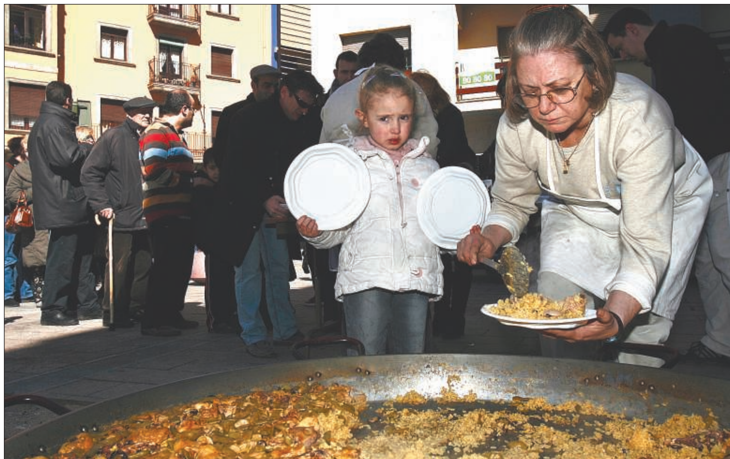
La paellada popular fa sis anys que se celebra, organitzada per l'ADMA.