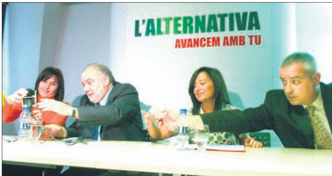
Els quatre caps de llista de l'Alternativa a Escaldes-Engordany.