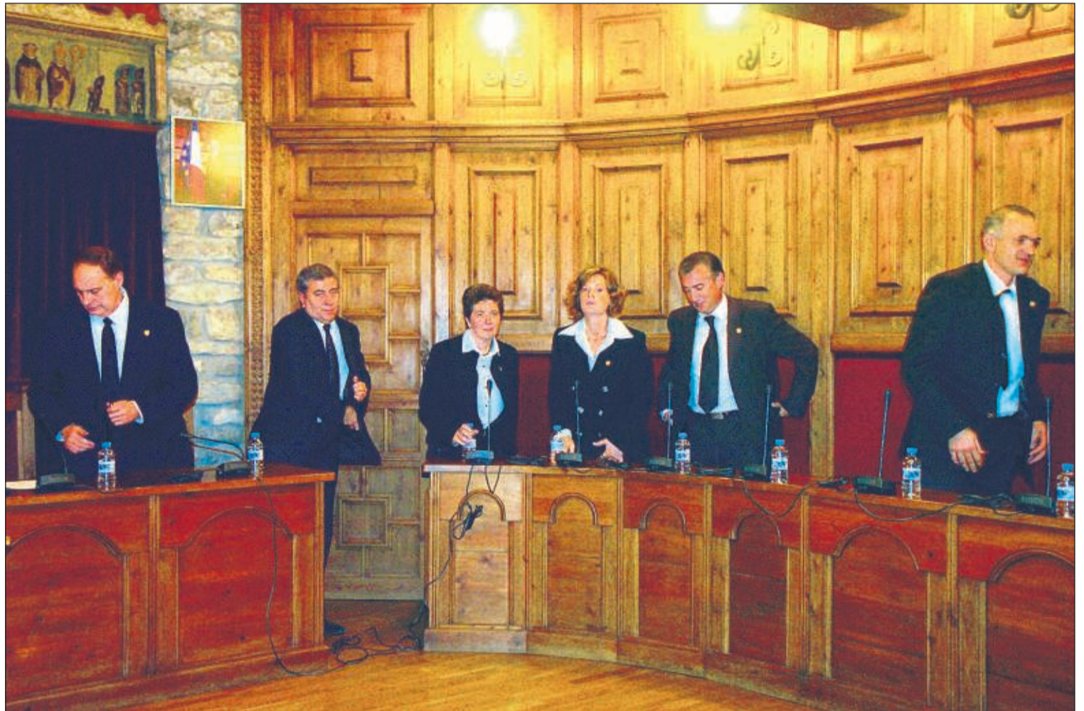
Sessió plenària a Sant Julià per validar les llistes, amb dos dels candidats a cònsol a banda i banda de la imatge.