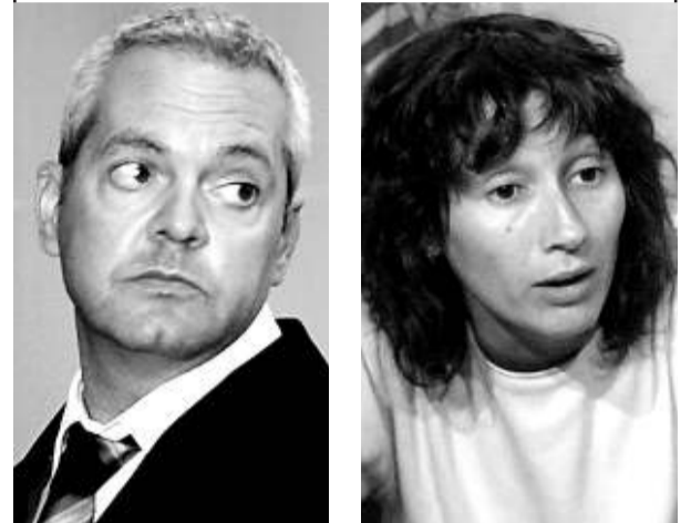
Bonaventura Esport. Consol Naudi.