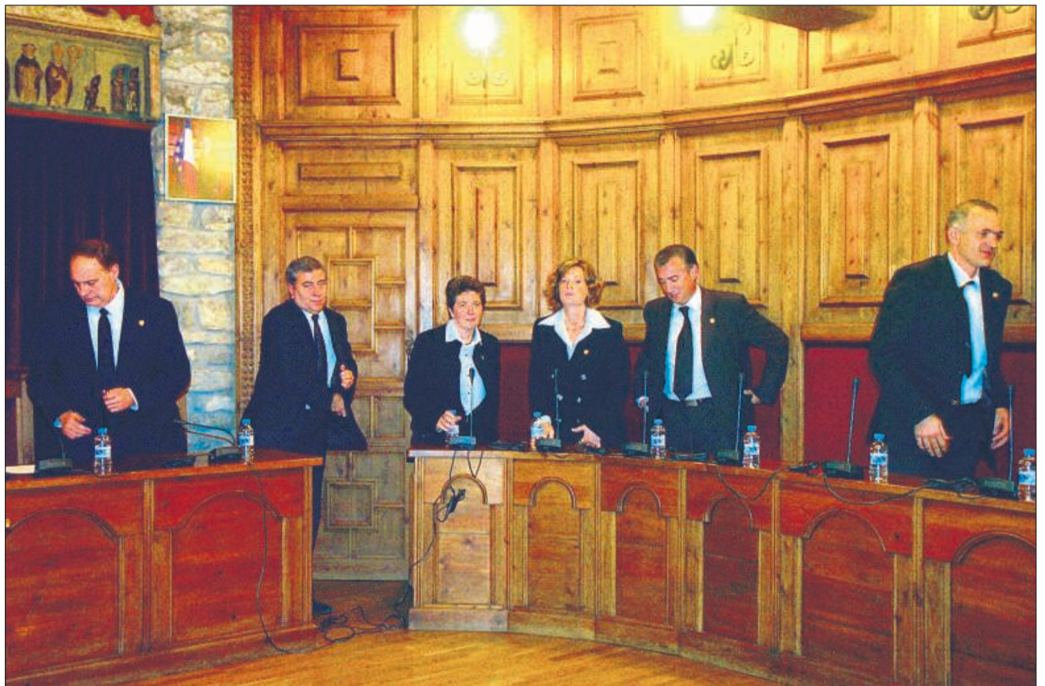
Sessió plenària a Sant Julià per validar les llistes, amb dos dels candidats a cònsol a banda i banda de la imatge.