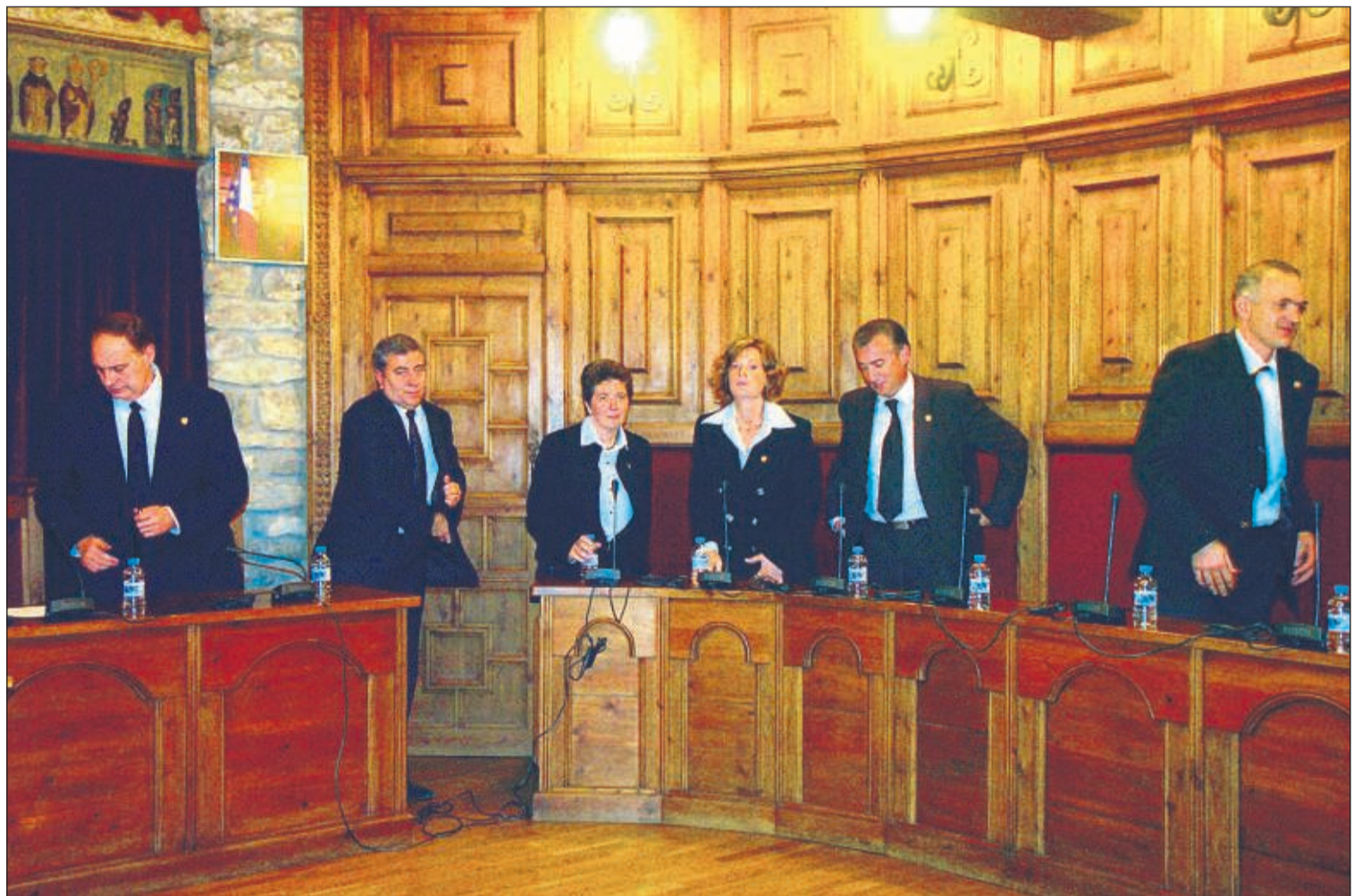
Sessió plenària a Sant Julià per validar les llistes, amb dos dels candidats a cònsol a banda i banda de la imatge.