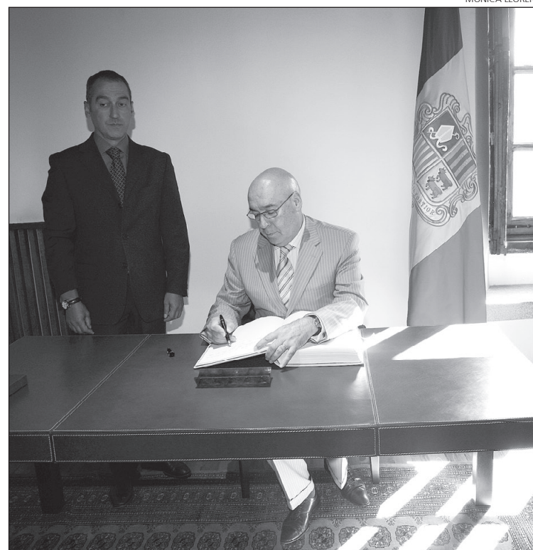
Rojo, durant la signatura del llibre d'honor a la Casa de la Vall.

Per acabar, la dinàmica de treball dels dos parlaments, els sistemes electorals i la situació d'Andorra van centrar la trobada entre el president del Senat espanyol i el president del grup parlamentari centrista. ■