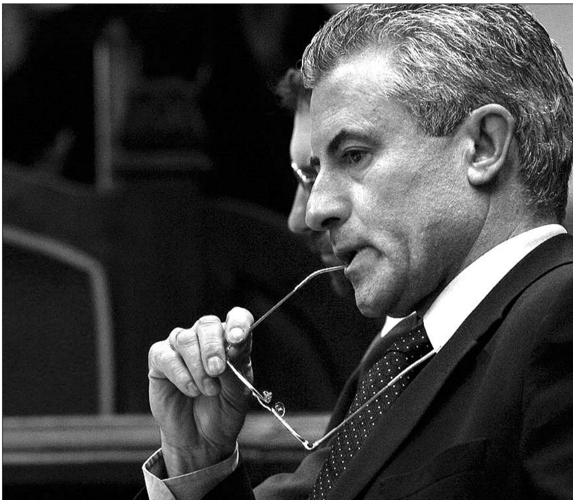
El ministre d'Interior va explicar al Consell els detalls de l'accident del túnel.

D'altra banda, el ministre va assegurar que cap responsable de l'empresa Construccions La Coma, subcontractada per Trebisa per fer el desenrunament de les obres –així com cap altra de les empreses implicades en els treballs– no tenia constància que s'hagués incorporat el noi a la feina. “Haurem de veure a l'informe si tenia contracte. Hi ha vuit dies per declarar un treballador a la CASS i veurem si l'empresa ho va fer o no”, hi va afegir el ministre. I també caldrà